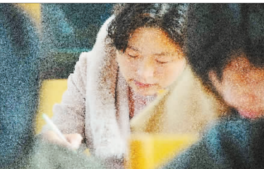
河南社旗县饶良镇的几名大学生村干部在接受项目培训。围绕农村资源、市场需求等内容,该县日前对数十名大学生村官进行创业项目培训,并组织农信社、SYB创业培训相关专业人员对大学生村官的创业计划进行科学论证,降低创业信贷资金扶持门槛。

会,一个是党的基层组织,一个是村民自治组织。从2010年底到2011年初,全国各地陆续启动新一轮的村两委换届选举。