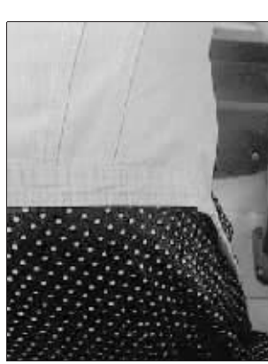
呼和浩特市广播电视台组织的专业笔试中有人在抄袭。

呼和浩特市人事局网站刊登的《呼和浩特市2011年事业单位公开招聘工作人员简章》(以下简称《招考简章》)显示：“2011年，市第一医院等54个事业单位面向社会公开招聘工作人员361人。”该通知的附件《呼和浩特市2011年事业单位公开招聘工作人员岗位表》显示，呼和浩特市广播电视台拟招聘6人，其中编辑记者2人、播音主持4人。编辑记者岗位的报考条件是：“专业不限、学历专科及以上全日制普通高等院校毕业生”；播音主持岗位的报考条件是：“专业不限、学历专科及以上、1980年4月1日以后出生，具有普通话测试证二级甲等及以上”。