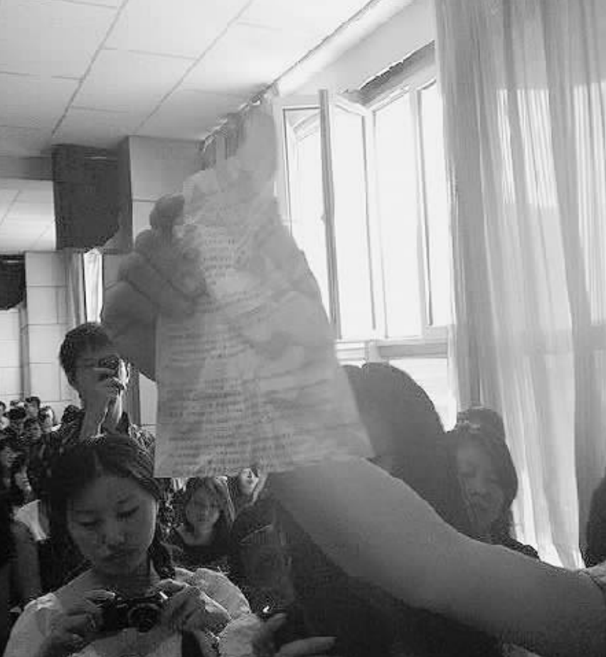
满分答案。

发现作弊情况后，很多考生十分气愤。有考生大声问道：这么严肃的社会招聘，何必做这些手脚呢？如果已经内定了，你们自己内部招聘就可以了，为什么还要收钱让我们来考试呢？