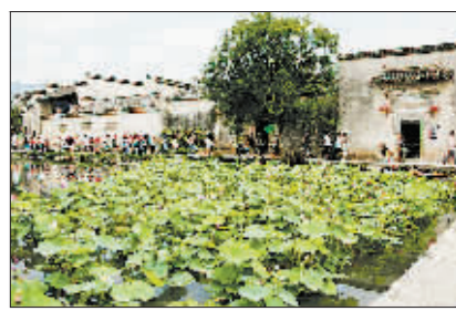
宏村南湖盛开的荷花。

如果你厌倦了大城市的喧嚣，皖南是最适合“私奔”的所在。行在云雾缭绕的山中，住在白墙黑瓦的徽州老屋中，让人觉得恍如隔世，生活节奏慢下来，浮躁的心情也随着放缓的呼吸而平复。回想一下