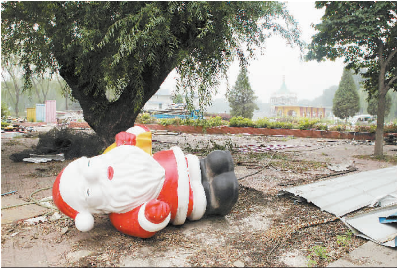
北京游乐园内的游艺厅附近,曾经迎接游客的圣诞老人如今被推倒在地。

而今年夏天,游乐园将彻底完成拆除工作,消息传开,很多北京人依依不舍。“游乐园刚建起时,北京人都觉得新鲜,那些大型玩具以前从没见过,每样都想玩。我后来有了孩子,也带他去。后来孩子大了,他自己攒零花钱,放学后去几个项目才回家。这些年游乐园增加不少项目,记得