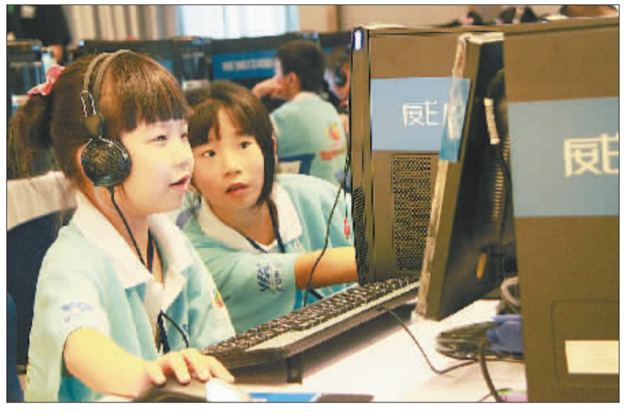
中国儿童青少年威盛中国芯计算机表演赛全国总决赛近日在北京威盛中国芯大厦举行，来自全国30个省区市的350名儿童和青少年计算机高手参加了本届赛事。图为大赛现场。

用户数还是在投融资方面，特别是从数据流量来看，整个行业呈现爆发式的增长。针对移动互联网发展趋势，他提出了自己的“1个目标+5个要素”。“1个目标”是指给用户带来体验，这也是最重要的目的。他认为所有的东西最后集中在一个体现出来，比如做芯片的时候想怎么样把芯片的能力体现在用户的体验上，做硬件的