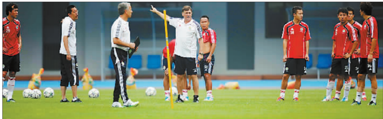
10月8日, 深圳体育场, 国足在主帅卡马乔的带领下进行训练。