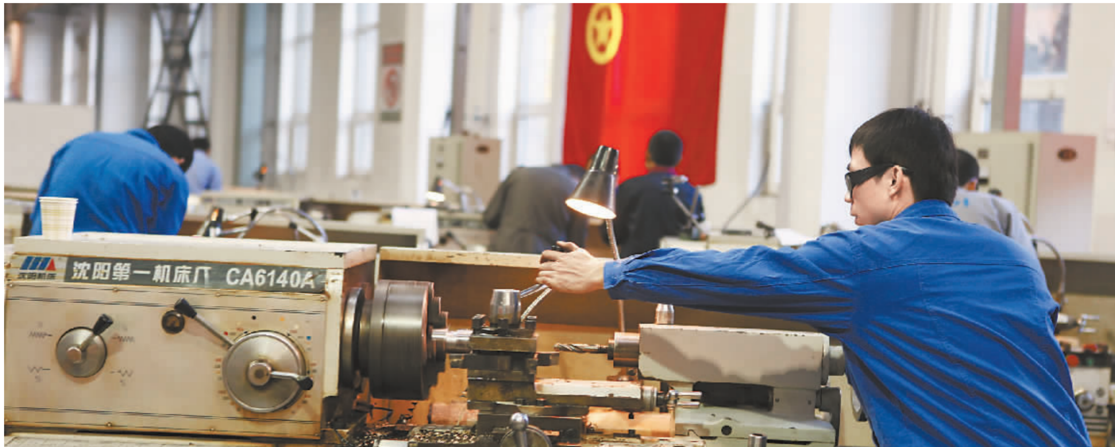
10月25日，车工选手在进行实际操作比赛。