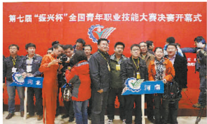
10月24日，第七届“振兴杯”全国青年职业技能大赛决赛开幕。开幕式结束后，各个代表团在台上留影。

自2005年起，“振兴杯”全国青年职业技能大赛作为国家级一类竞赛，每年举办一届，已连续举办七届。大赛以提升青年技能素质为目标，已成为团组织辅助企业人力资源开发的有效载体和重要途径，在加强青年技能人才队伍建设方面发挥了积极作用。