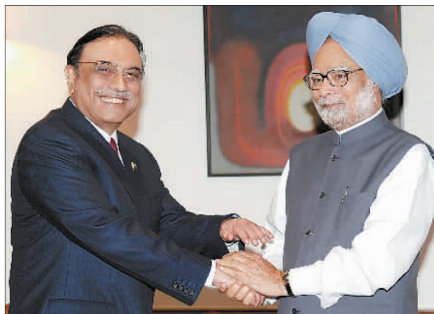
印度总理辛格8日在新德里与到访的巴基斯坦总统扎尔达里(左)握手。