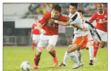
4月8日,在中超联赛的焦点战中,广州恒大主场以1:1战平贵州人和队。