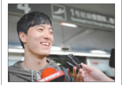
5月7日,在川崎大奖赛上夺得赛季首个室外赛冠军的刘翔,回到上海时表情轻松。