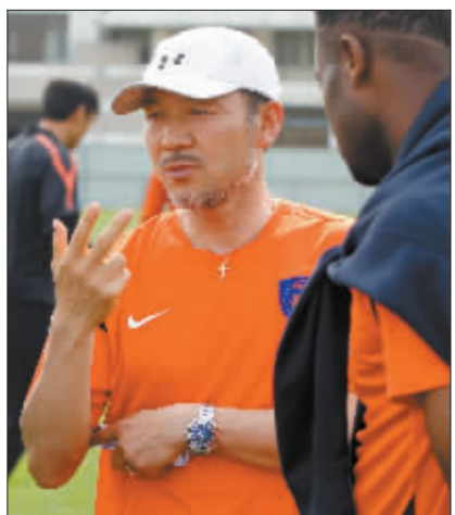
重回青岛中能执教的韩国人张外龙受到球迷追捧。