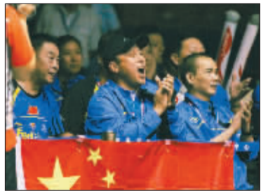
中国羽毛球队主教练李永波在尤伯杯决赛现场为队员激情呐喊。

武汉把汤尤杯办成了武汉球迷的狂欢节,中国队把汤尤杯当成了自己的狂欢节,但这绝不是世界羽坛的热闹,更不要说那些羽坛之外的世界。