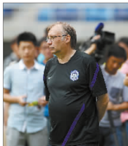
受罚后的天津泰达主教练库泽泽训练场上神情严肃。