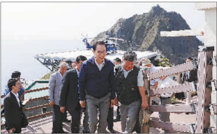
8月10日,韩国总统李明博(前右二)抵达与日本存在主权争议的独岛(日本称竹岛)。

独岛位于朝鲜半岛东部海域,面积0.18平方公里。朝鲜、韩国、日本都宣布对该岛拥有主权。目前韩国实际控制这一岛屿。