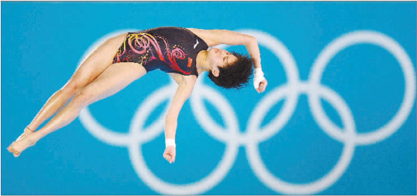
8月9日,陈若琳在比赛中。