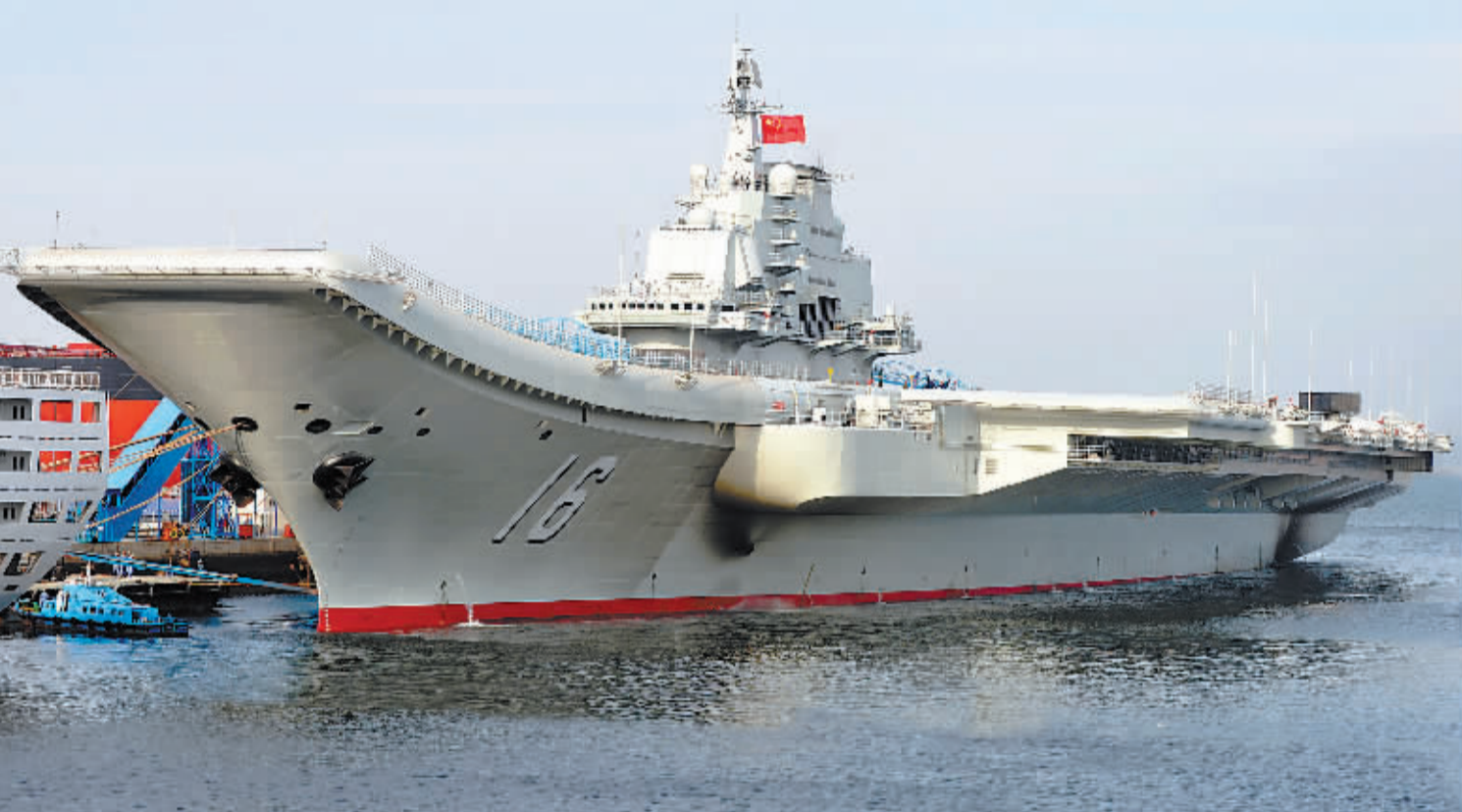
9月25日，我国第一艘航空母舰“辽宁舰”已按计划完成建造和试验试航工作。这是中国海军航母平台港内停泊照片。

胡锦涛出席交接入列仪式并登舰视察 温家宝宣读党中央国务院中央军委贺电 郭伯雄徐才厚马凯常万全吴胜利出席