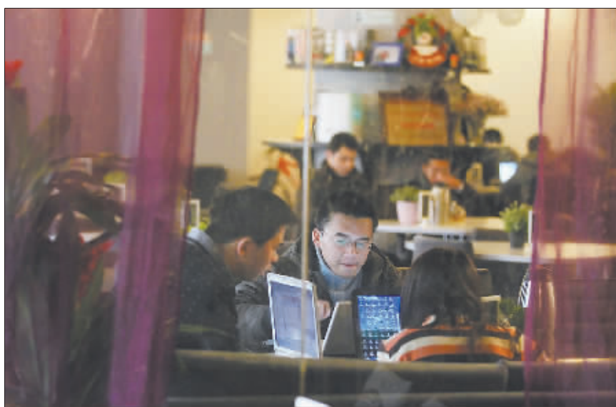
年轻人正在北京车库咖啡店里上网。车库咖啡于2011年4月开始营业,是一家以创业和投资为主题的咖啡厅,创业者只需每人每天点一杯咖啡,就可以在这里享用一天的免费开放式办公环境。

2012年2月13日本刊以《一位警院学生的4次创业》为题,报道了福建警察学院2009级行政管理专业学生杨子阳在两年半里,先后经历了卖洗发水、代理茶饮料、做网站和回收闲置物品等4次创业历程。但由于学校市场小、物品繁杂回收标准难以确定、以书本居多的二手货利润空间小等原因,看似前景不错的回收闲置物品生意难以维持。经过两个多月的尝试,在将全部回收来的书本以每吨1300元的价格卖