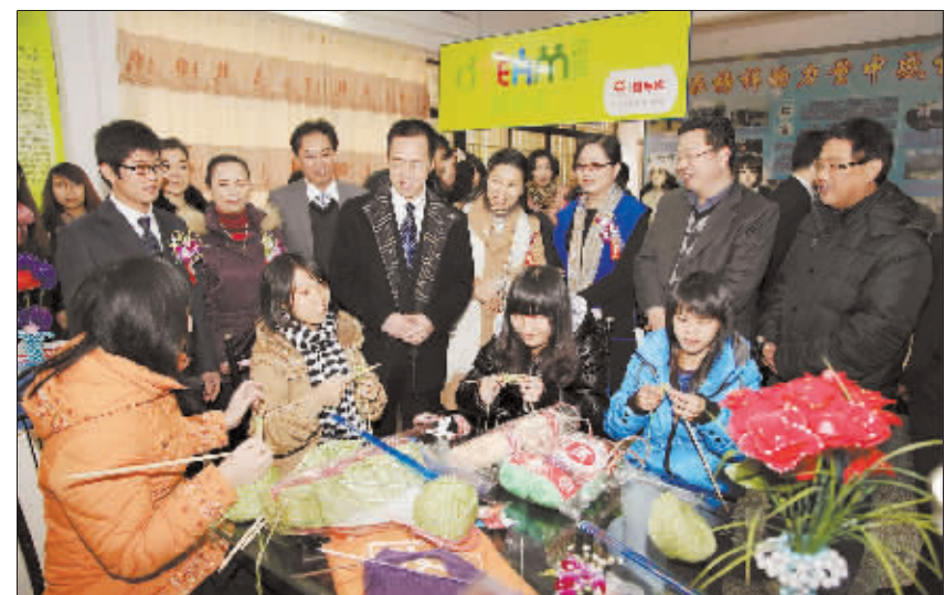
2012年12月12日,“青年恒好”大学生公益创业展示活动“织梦”编织吧落地仪式在广西柳州市举行,柳州职业技术学院KAB创业俱乐部的“民族风”创业团队获得5万元资助。图为嘉宾在仪式结束后参观编织吧。

在第二届“青年恒好”成果发布会上,恒源祥(集团)有限公司总经理陈忠伟表示:“青年创业梦想的实现,将为中国梦的实现,构筑坚实的基础。希望广大青年可以坚持梦想,勇敢走下去。”