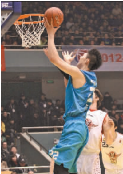
2月17日，王哲林在CBA常规赛最后一轮较量中。

“现在的中国篮球，还停留在依靠天才球员出现带动整体水平提高的层面，”某专业教练告诉记者，“很多训练理念比较落后。CBA现在在高水平外援很多，年轻队员在同外援的训练和比赛中得到提高，就是很