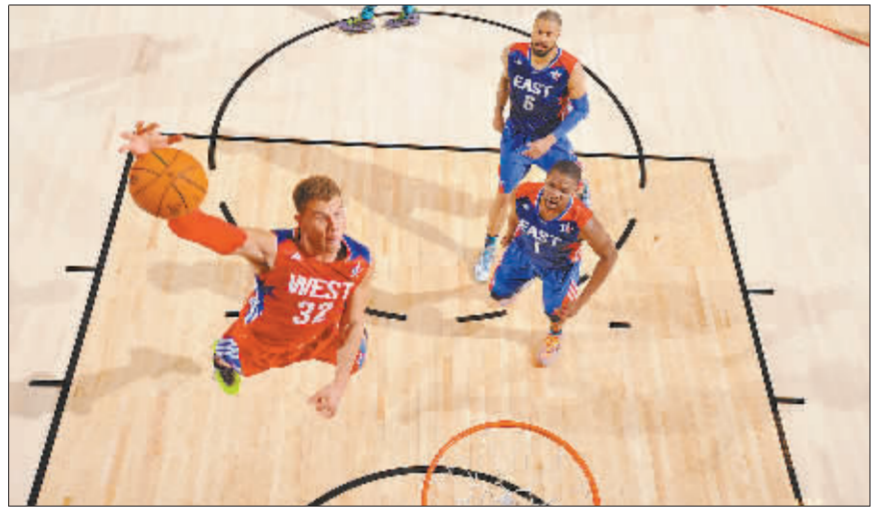
2月18日，格里芬在全明星正赛上暴扣。

“现在事情就算告一段落了，但隐患还在，就是前面的审判加这次的处罚，大多是因为行贿受贿和操纵比赛，对于赌球的处理不多。实际上，这是对足球危害最大的一种行为，也是现代足球运动发展最大的毒瘤，最近一些足坛的大案，全都是赌博集团操纵的。”一位体育法学专家告诉记者，“关于‘贿赂’和‘不正当交易’，足协《罚则》里面都有涉及，实际上，对‘赌博’也有界定，包括有构成违法犯罪的移交有关部门处理，但这远远不够。所以，这次行业处罚无论轻重，总算是有个交代，保护俱乐部也好，维护联赛秩序也好，都已经这样就没法追究了，但是现在，一定要作好各种防范，特别是建立健全法规制度，等到出了问题再后悔就不好办了。” 本报北京2月18日电