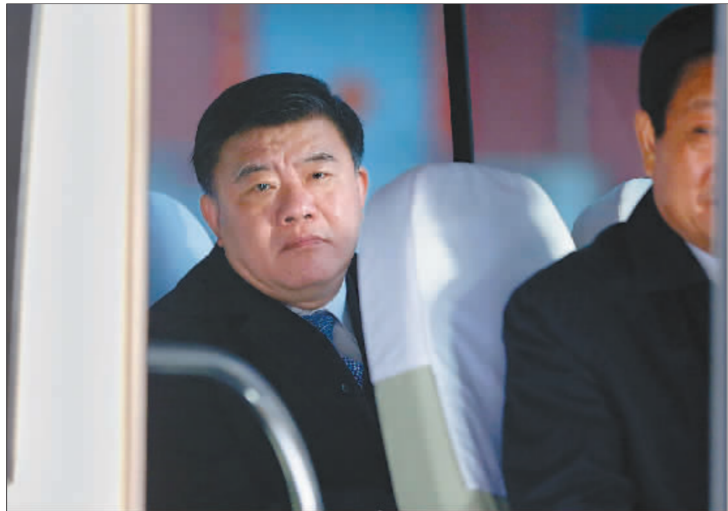
↑3月9日,车内的全国人大代表、卫生部部长陈竺。

3月10日,中国国务院机构改革和职能转变方案公布。新一轮国务院机构改革即将启动,国务院正部级机构减少4个,国务院组成部门将减少至25个。