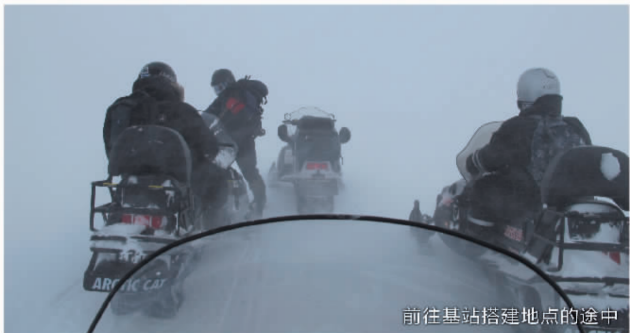
前往基站搭建地点的途中

这里临近北极点,距离挪威大陆两千公里,最低气温接近零下50摄氏度。因为岛上地形复杂,我们使用了雪地摩托、叉车、直升机和小型飞机等各种工具来运输设备。同时还得随身配备上膛的猎枪,预防北极熊的攻击。