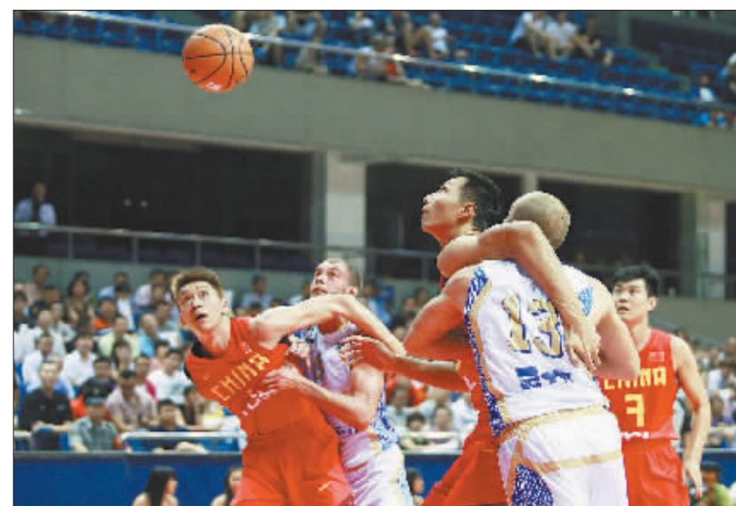
6月25日,中国男篮与乌克兰男篮球员在比赛中拼抢。