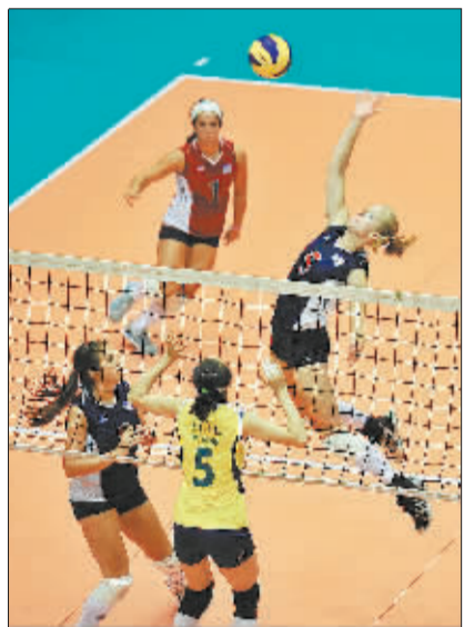
美国大学生希望之星队在比赛中。

2013年中美女排超级对抗赛,6月23日~25日在北京大学生体育馆举行。虽然两支美国大学生球队很难从中国排坛劲旅天津队和八一队身上占到便宜,但中国的教练员和运动员仍然对这两支大学生球队给予了高度重视。毕竟,在北京和伦敦两届奥运会上均取得亚军的美国女排,都是以大