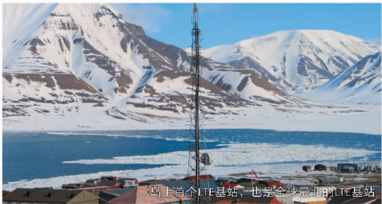
岛上首个LTE基站,也是全球最北的LTE基站