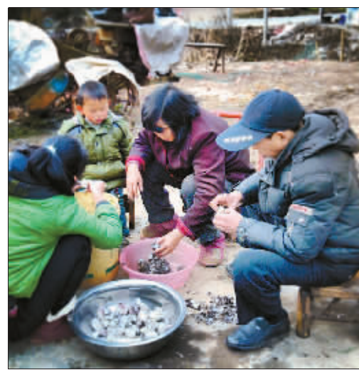
江西铜鼓 家人一起过元宵节, 这一天也是老妈的生日。