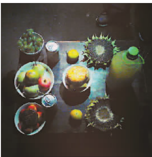
河北张家口 2013年的中秋节, 按习俗供奉月亮。