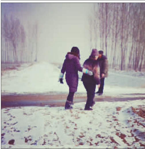
河南南阳 家乡的冬日。 拍摄者: 齐丽霞 (“木兰社区”公益组织负责人, 来京5年)