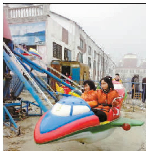
河南兰考 飞。