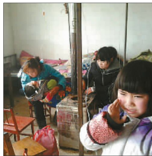
山东巨野 女儿感冒了, 在村里的医务室输液。