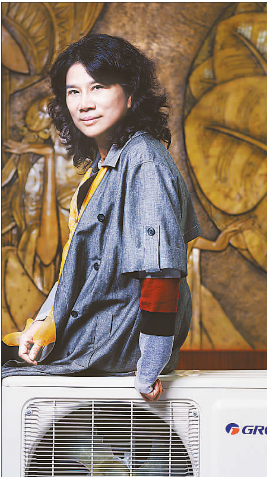
格力电器董事长兼总裁董明珠

紫色四合，董明珠又换上坚硬的球鞋，和往常一样，她会回到家中，为自己煮一碗面，然后出去散步。于她而言，独自行走，也是一种人生态度。