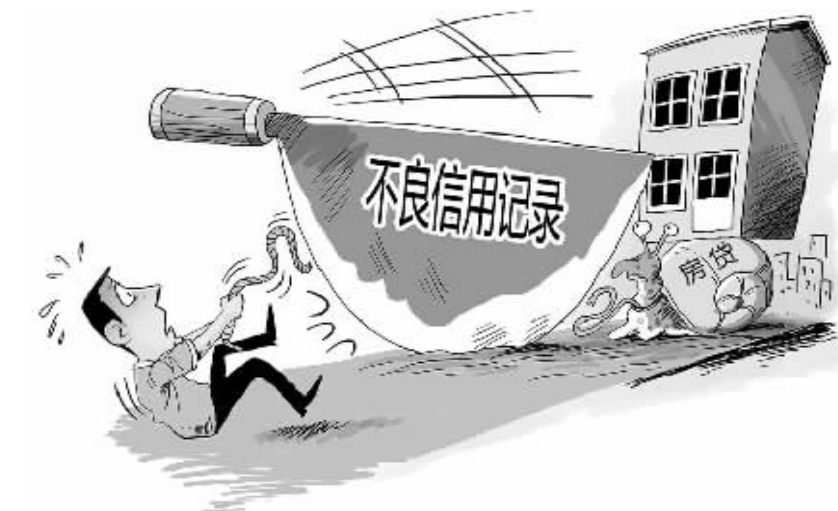
个人信用不良记录将导致贷不到房贷等严重后果。

虽然高校食堂饭菜价格比较适中,但对于其质量,大多数受访者表示不满意。在问及受访者所在大学食堂饭菜质量怎么样时,给予好评的仅占18.6%,42.8%的受访者觉得一般,35.2%的受访者直接给了差评。