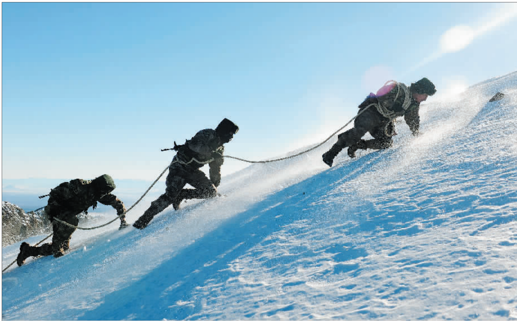
1月19日，沈阳军区长白山天池哨所官兵在巡逻。