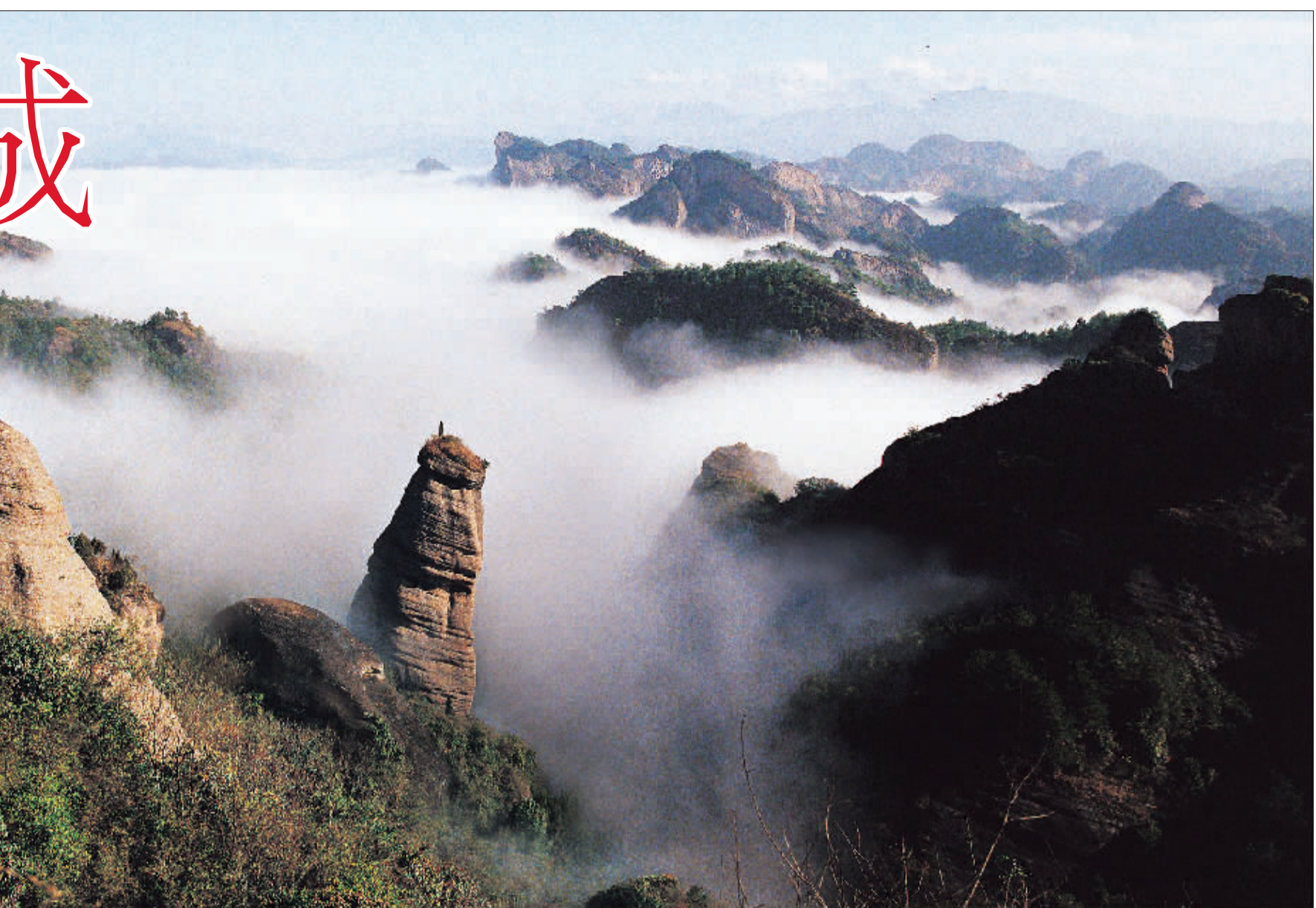
冠豸山 (Guanzhai Mountain) 冠豸山位于县城以东1.5公里处，以主峰形似古代“鬚冠”而得名，寓含刚正廉明之意。景区总面积123平方公里，集“山、水、岩、泉、寺”为一体，“雄、奇、幽、秀、绝”诸特点于一身，而其中最突出的景观就是被称为“阳刚天下雄”的生命之根。