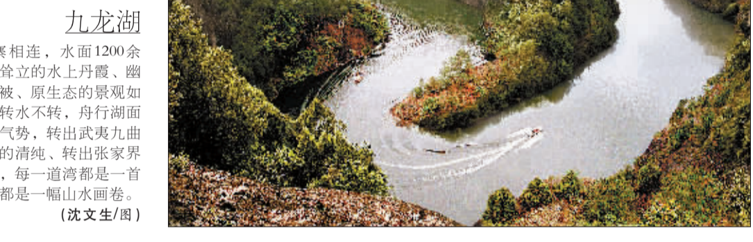
九龙湖 (Jiulong Lake) 九龙湖与竹安寨相连，水面1200余亩，纵深24公里。其冷立的水上丹霞、幽深的峡谷、苍翠的植被、原生态的景观如梦如幻。九龙湖山不转水转，舟行湖面却能转出长江三峡的气势，转出武夷九曲的情调，转出九寨沟的清幽，转出张家界的神韵……远观近游，每一道湾都是一首诗仙绝唱；每一座山都是一幅山水画卷。