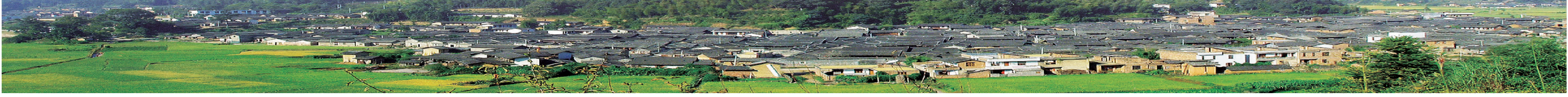
培田古村落 (Beitian Ancient Village) 培田古村落是全国重点文物保护单位，国家4A级旅游景区，国家历史文化名城，全国旅游景观特色名片，连续两次被评为十大“中国最美村镇”。建筑群由三十幢高堂华屋、二十一座古祠、六家古书院、两道跨街牌坊和一条千米古街组成。“九厅十八井”的建筑风格，与福建永定土楼、广东梅州客家围龙屋一同并称为客家建筑三大奇观，彰显客家建筑顶级风貌。