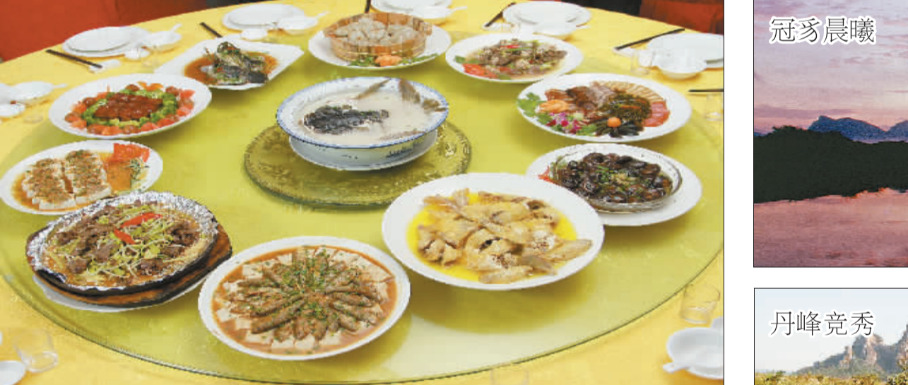
连城美食 (Liancheng Cuisine) 连城是“中国客家美食名城”，以“湖九品”、“溪鱼焖豆腐”等为代表的客家美食多次荣获各类大赛金奖。有“闽西八大干”之首的连城红心地瓜干；“全国唯一药用鸭”，被誉为“鸭类中的国粹”的连城白鸭鸭。此外，还有捆、灯笼糕、珍珠丸、李子包等64种客家小吃，让您体验舌尖上的连城。

连城旅游名片 ——连城是首批中国优秀旅游县、中国文化旅游大县、中国客家美食名城、中国温泉之城、中国红心地瓜干之乡、中国白鸭之乡、中国客家民俗文化之乡、全国武术之乡、全国双拥模范县。 连城交通攻略 ——目前，连城已建成龙岩冠豸山机场、赣龙铁路、厦蓉和长深两条高速公路以及205和319两条国道，是全国为数不多同时拥有“铁、公、机”立体交通网络的县份之一。此前，上海到连城的航班也正式开通，飞行时间仅80分钟。如今，连城还规划建设了18条1000多公里的自行车骑行线路。清新连城，骑乐无穷。连城，正全力打造中国自行车骑行旅游和竞技比赛的快乐之旅。 连城旅游攻略 ——D1巴士、动车或飞机前往连城，可体验天一温泉。D2上午游览冠豸山、石门湖景区，下午前往明口兰博园、培田古村落。D3上午游览竹安寨、九龙湖景区，下午参观四堡雕版印刷文化遗址，晚餐后返程或愉快前往下一个旅程。