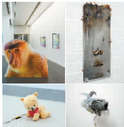
竟‘网络艺术’咱们这些普通老百姓都不怎么懂，‘后网络艺术’就更难懂了。

泽传媒表示，在参与今年两会全媒体报道的全国33家省级卫视频道中，江苏卫视、湖南卫视、北京卫视、浙江卫视、东方卫视分列全媒体传播指数前五名。