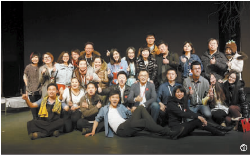
①三四剧社主要成员合影 ②话剧《非典型爱情病例》海报 ③在演员家里排练微话剧

摸着石头过河，9名演员用3个月时间完成了《非典型爱情病例》的排练，还一起凑了几百元钱租下了吉林艺术学院的小剧场。