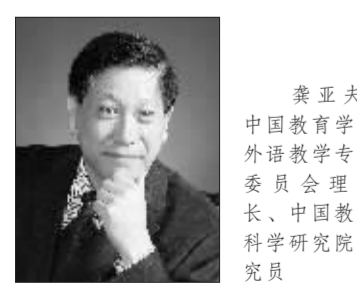
龚亚夫,中国教育学会外语教学专业委员会理事长、中国教育科学研究院研究员