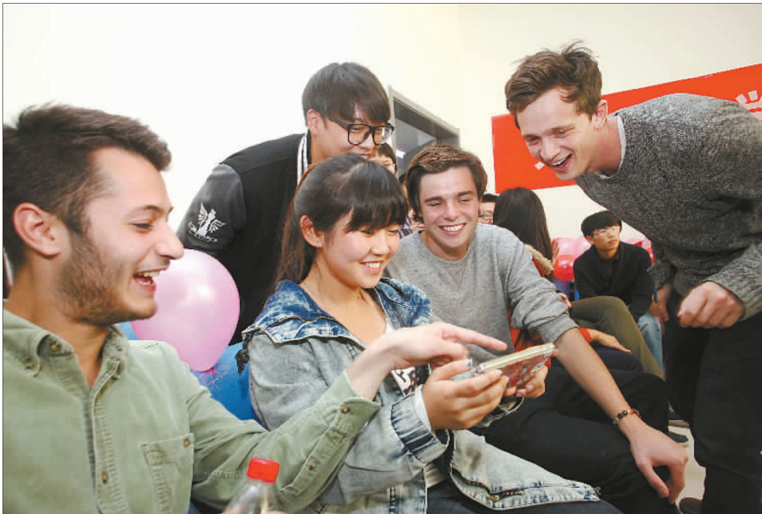
10月22日，中英两国学生在见面会上交流互动。

当日，获得“英国文化协会—天津奖学金”的首批12名来自英国的大学学生，在天津工业大学和他们的中国同学见面。该奖学金由天津市教育委员会和英国驻华使馆联合设立。首批12名英国大学生将在天津工业大学进行一个学期的经济专业课程的学习。