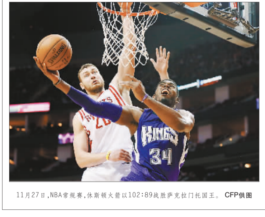
11月27日，NBA常规赛，休斯顿火箭以102:89战胜萨克拉门托国王。

全国武术段位制工作会议落幕 本报讯 （记者慈鑫）为期3天的2014年全国武术段位制工作会议11月27日在北京落幕，全国武术段位制进学校高峰论坛、2014年国家武术研究院专家委员会年会及换届仪式和国家体育总局武术研究院青年学者工作委员会工作会议也同时结束。此前进行的全国武术段位制进学校高峰论坛中，北京体育大学和上海体育学院等高校专家就武术段位制进学校的推广战略、模式和竞赛考评办法等问题进行深入探讨。