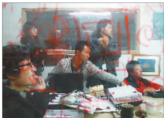
2011年12月,这一天是我和他的牵手纪念日,但大家一直在加班开会,早把这个日子抛到了脑后。