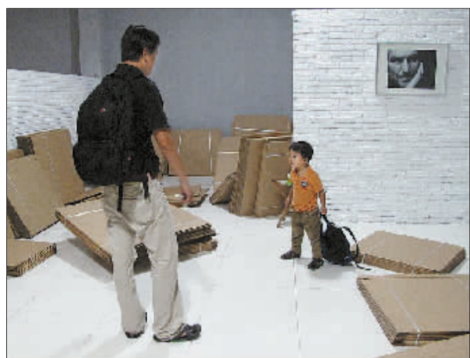
2011年六一,晚上11点,卡卡还在等我们下班陪他过六一。