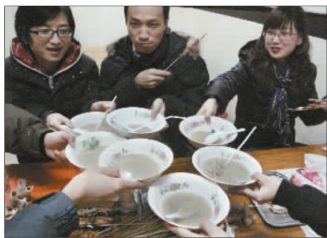
2011年12月,第一个“双11”销售小高峰后,我们一起去路边喝羊汤庆祝。