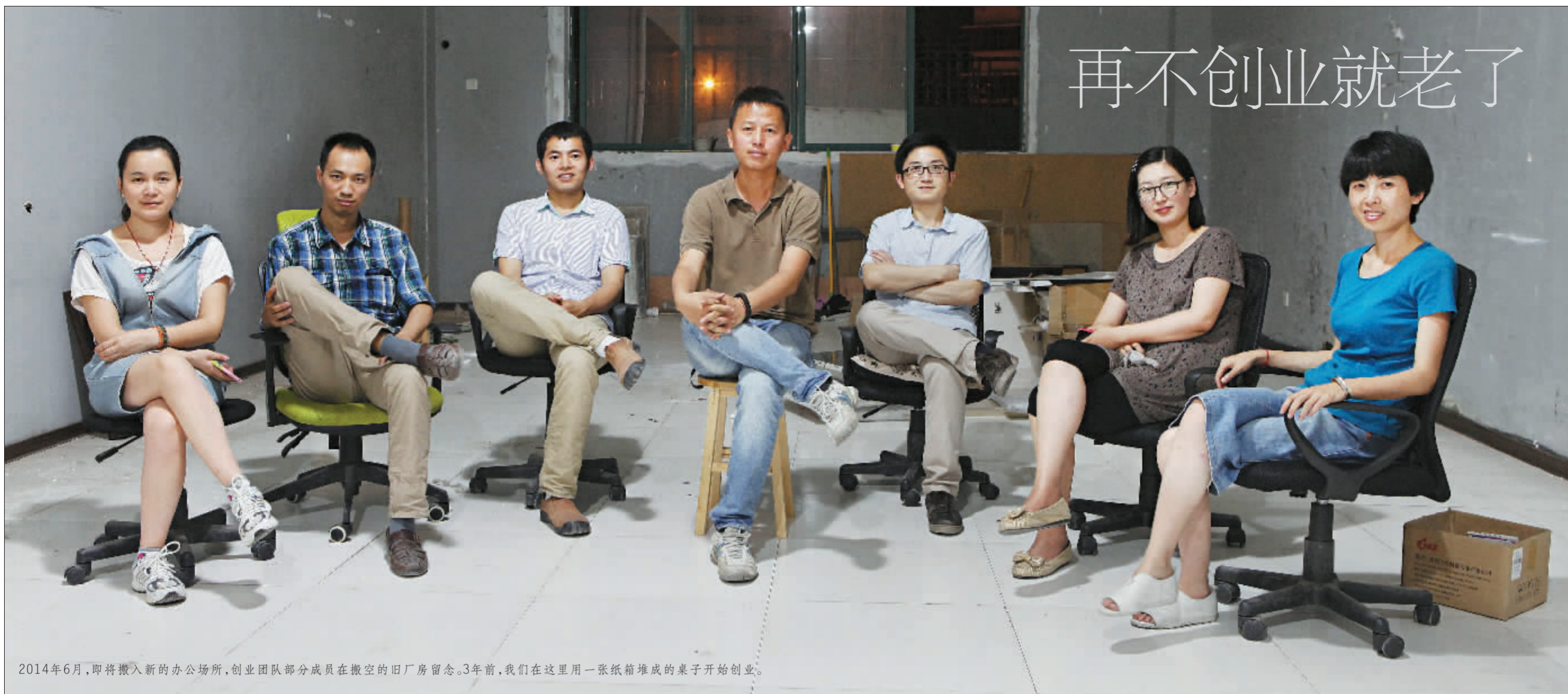
2014年6月,即将搬入新的办公场所,创业团队部分成员在搬空的旧厂房留念。3年前,我们在这里用一张纸箱堆成的桌子开始创业。