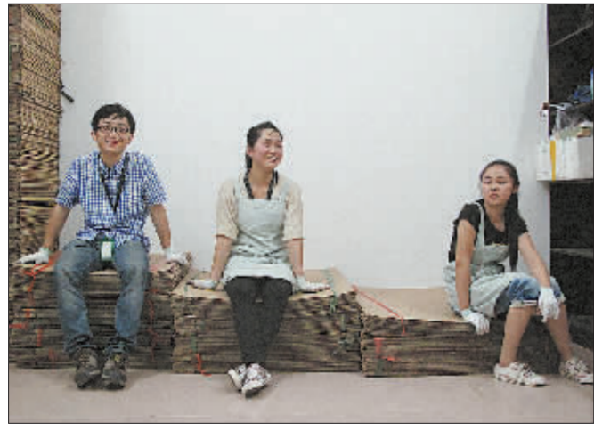
2012年6月,搬货的时候,不管是研究生还是女汉子,都会齐心协力。如今团队里有了不少研究生和海归。