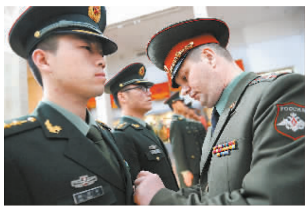
5月6日,在俄罗斯首都莫斯科,中国人民解放军三军仪仗队士兵接受俄罗斯国防部代表授勋。俄罗斯国防部6日在莫斯科授予参加红场阅兵的中国仪仗队纪念勋章。112名中国人民解放军三军仪仗队官兵将于9日参加纪念卫国战争胜利70周年红场阅兵。