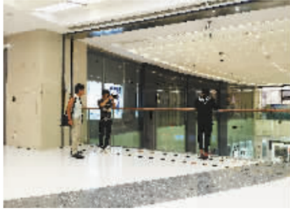
助教正在为学员拍摄用于形象展示的照片。

而经过恋爱培训班的洗礼，此后的恋爱，在他看来就像打一场真的战争那样见招拆招。说最恰当的话，做最得体的事，时时都给自己留好后路，永远都充满戒备。他们的关系理智、恰当、独立、自由、各取所需。