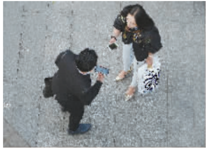
一名恋爱培训师在街头成功搭讪一个女孩。

“女人的社交直觉要比男人强很多倍，她对你的判断全部来自这些细节。”导师告诉学员们，外形和朋友圈是留给女孩的第一印象，而要达到“吸引”，接下来更重要的是高价值展示。