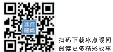
扫码下载冰点暖闻 阅读更多精彩内容

小许买下了1600斤瓜以后拍照发了朋友圈，本来只是感叹一下，没想到很快得到了大家强烈的支持。大家通过微信转账的方式找小许买瓜，不到2小时所有的瓜便卖出去了，有位爱心人士当时就买了1000斤，反倒让小许总共欠下了1000多斤的瓜“债”。小许说，会找那位瓜农把欠的瓜补上，然后按照“爱心叮嘱”将瓜送到福利院。这次有点众筹意味的“卖瓜”，无关挣钱，却让瓜甜到了很多人。