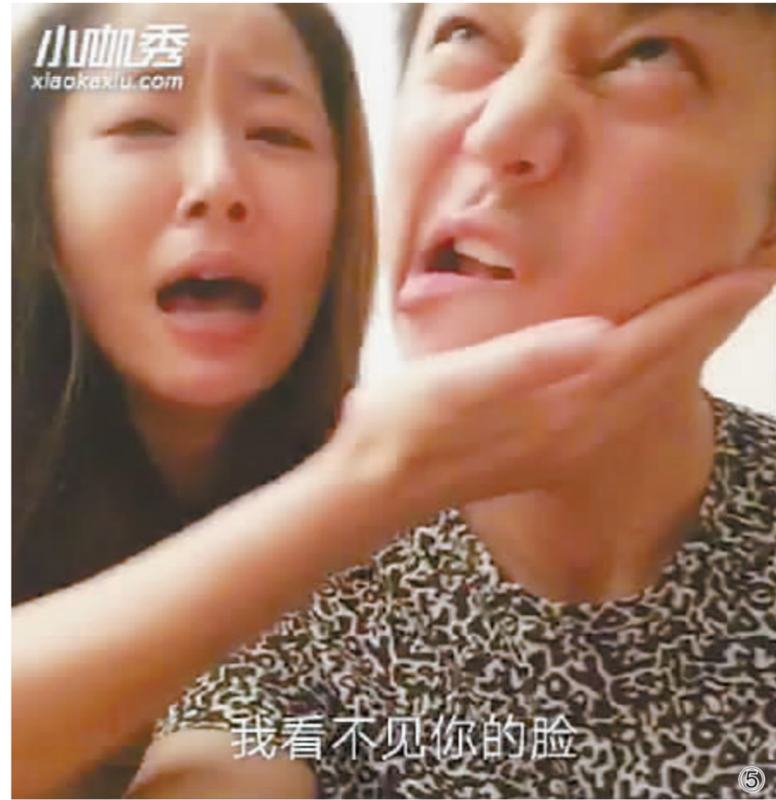
图中蒋欣①、林永健②、李小璐③、包贝尔④、林心如⑤何炅⑥晒出自己的“小咖秀”作品

雷涛自知，“小咖秀”的火是多种因素共同存在的结果。界面简单、上手容易、轻松易学，以及每天上新的软件库素材让用户保持兴奋，是产品成功的重要原因。曾经留存于人们心底里的经典影视作品、被街头巷尾传唱的歌曲全部都能在“小咖秀”里找到。恶搞的同时，顺便缅怀了青春和童年，团队牢牢抓住了80、90后的怀旧心理。