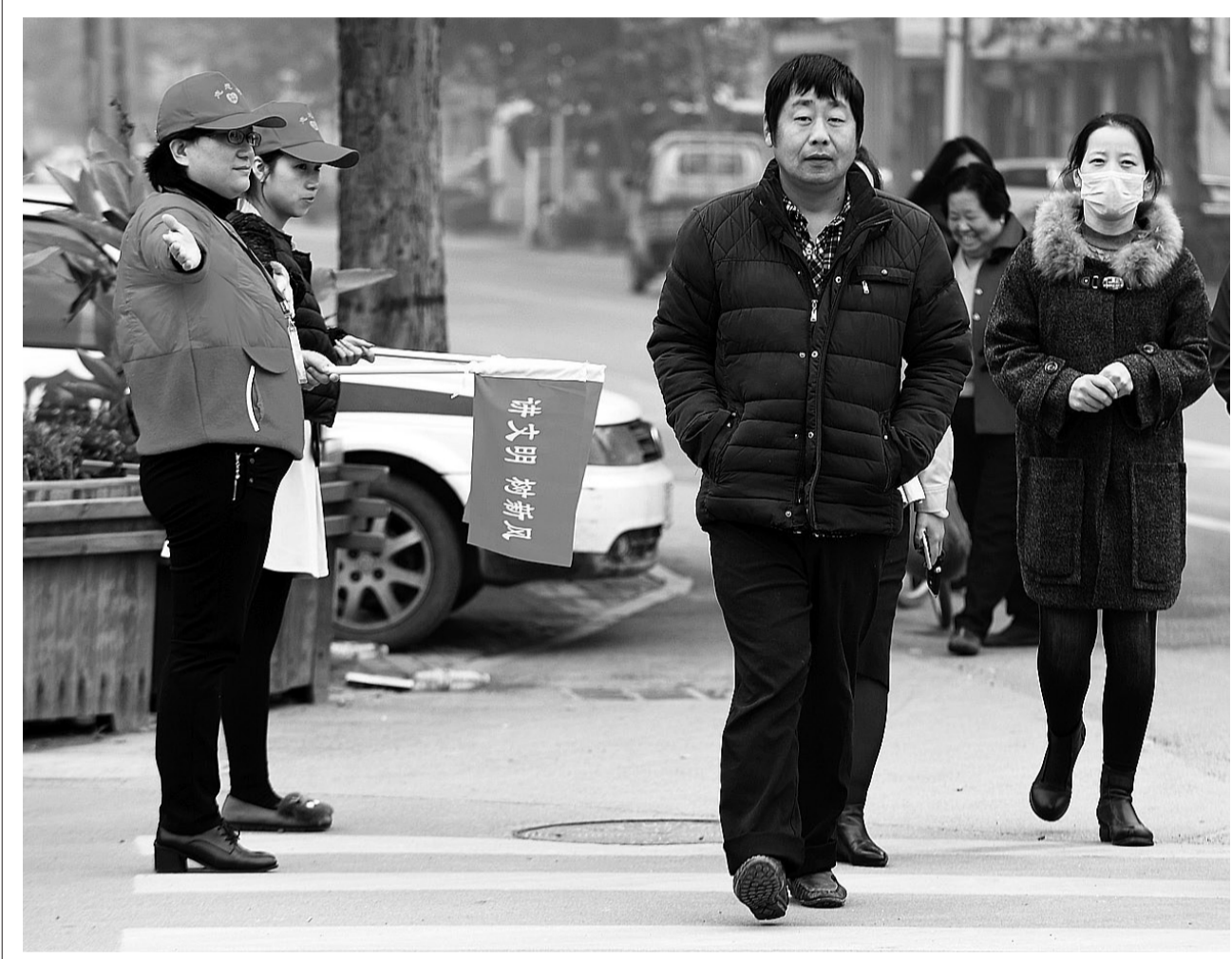
10月24日，永清县的志愿者在红绿灯路口引导市民文明过马路。日前，河北省永清县启动以 讲道德、树新风、携手共创文明城 为主题的群众志愿服务活动。