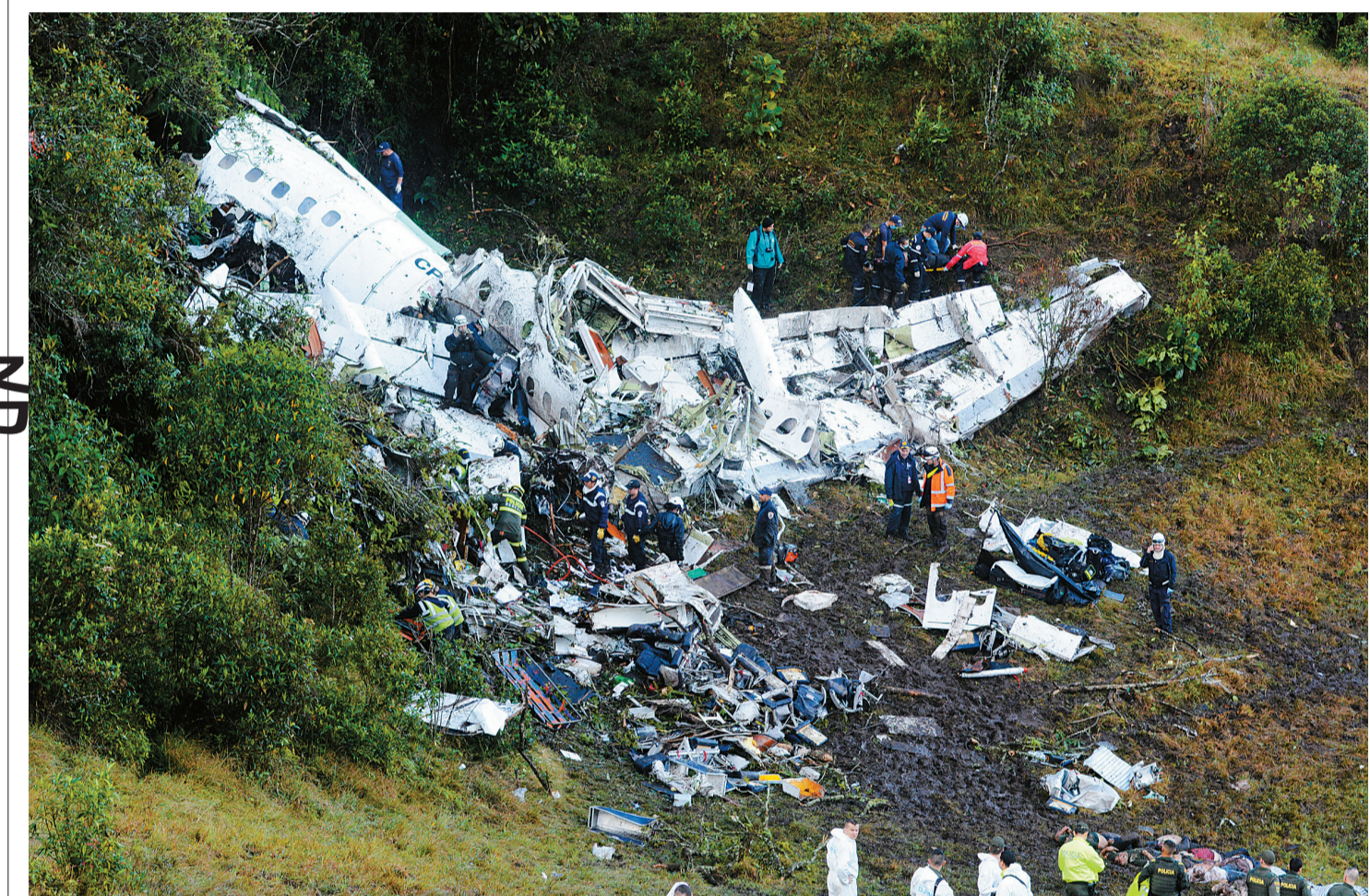
11月29日,在哥伦比亚麦德林市附近的拉乌尼翁,救援人员在坠机现场搜寻幸存者。