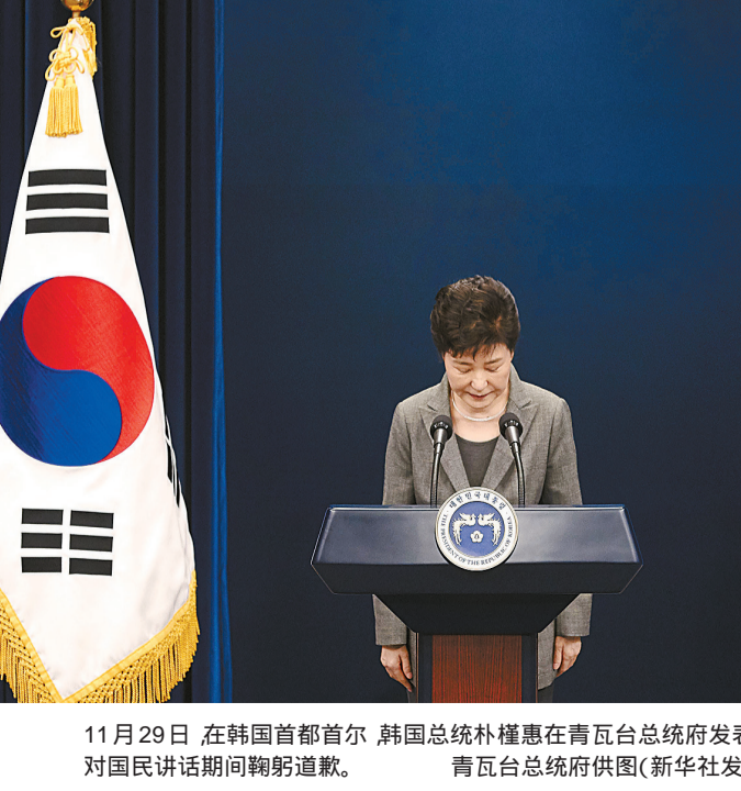
11月29日,在韩国首都首尔,韩国总统朴槿惠在青瓦台总统府发表对国民讲话期间鞠躬道歉。

目前,弹劾总统已成为韩国绝大多数政治派别的共识。根据韩国法律,弹劾总统需要得到国会300名议员中三分之二以上同意才能通过。(下转4版)