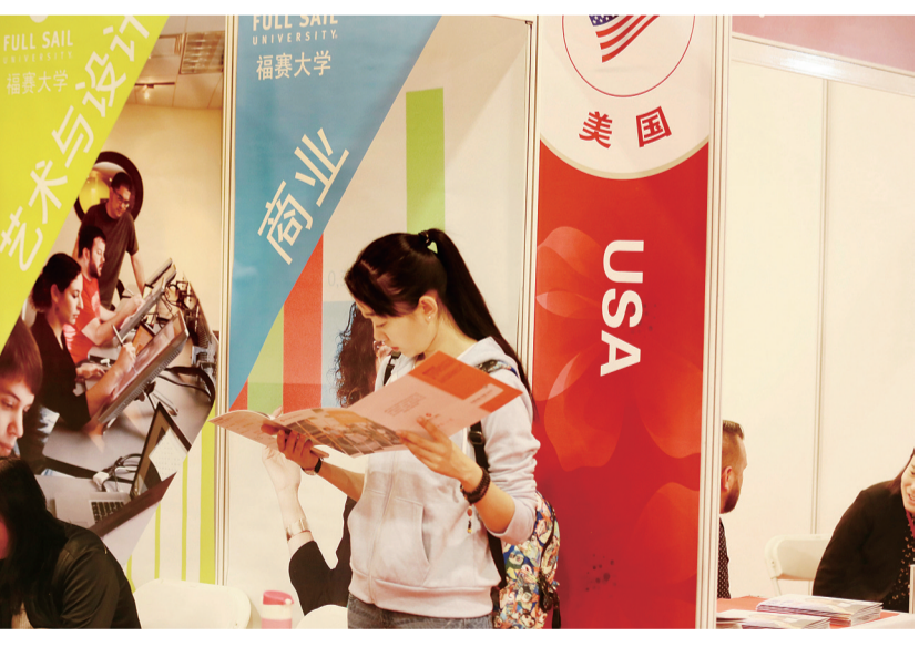
视觉中国供图（资料图片）