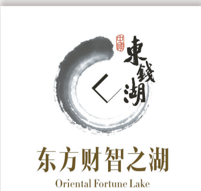
东方财智之湖 Oriental Fortune Lake

如今，东钱湖更是处于浙东旅游网络的中心节点，辐射范围向杭州湾地区，并以沪-甬-杭-绍为重点，向周边省市全方位扩展。东有海天佛国普陀山，南有奉化溪口蒋氏故里和雁荡山、天台山、楠溪江，西有金华双龙洞、兰溪地下长河，北接洋洋东方大港 宁波港。