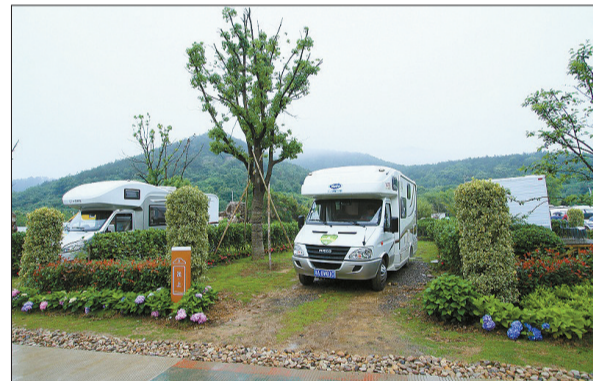
东钱湖的休闲设施

对内，东钱湖求“慢”，打造了骑行东钱湖、舟行东钱湖、车行东钱湖、步行东钱湖这“四行东钱湖”的慢行新业态。骑行方面，建成国内首条生态观光自行车专用道，环湖45公里，将全线贯通，并开辟山地自行车道；舟行方面，以游船为基础开通水上巴士，建成了龙舟基地、帆船帆板基地、皮划艇基地，游艇基地即将完工；车行方面，建成了国际房车基地；步行方面，建成了帐篷基地和滨湖、登山步道系统。