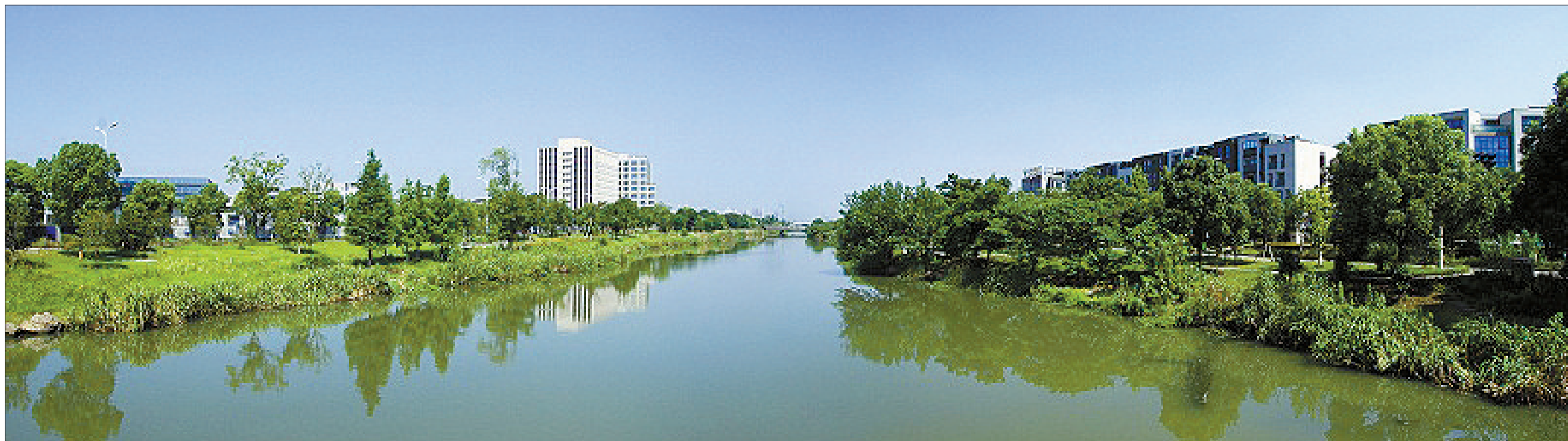
东钱湖的美丽景色

怀揣梦想的东钱湖人，为了梦想中的崭新家园，为了让这块璞玉重放光彩，以一种改天换地的精神，一种执着追求的信念支撑着，不停地为东钱湖开发建设这一“千秋工程”添砖加瓦。