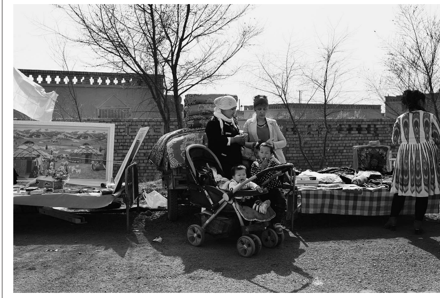
两名带着孩子的妇女在路边休息。

巴扎 是维吾尔语，意为集市、农贸市场，它遍布新疆各地。春暖花开的吐鲁番，山脚村头的 巴扎 也日渐多了起来。十里八乡的百姓纷纷走出家门赶 巴扎 品尝美食、置办新衣、购买农具，在人头攒动、热闹欢乐的 巴扎 中感受春日的美好。