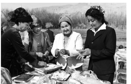
几名妇女在包 曲曲儿（维吾尔语，一种类似于馄饨的面食）。