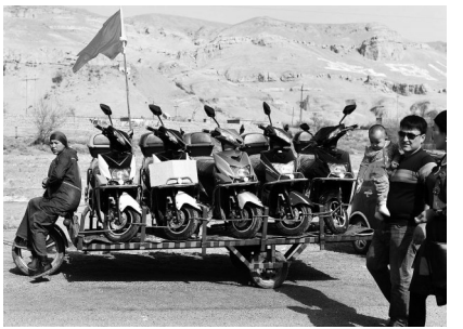
一名妇女在摆摊售卖摩托车。