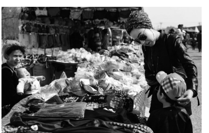
一位母亲在给与孩子试戴遮阳帽。