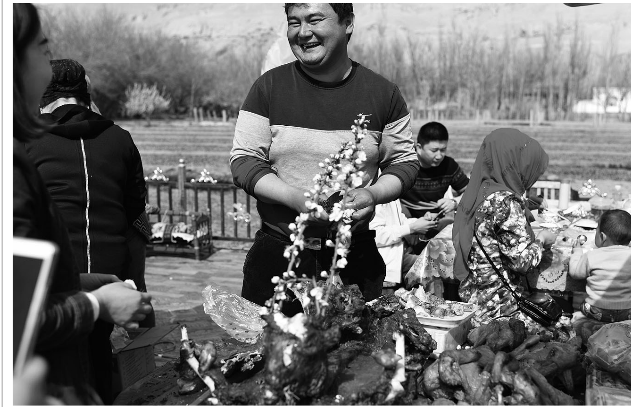
在新疆吐鲁番市高昌区艾丁湖乡也木什村的 巴扎 上，一名商贩在和顾客交流。