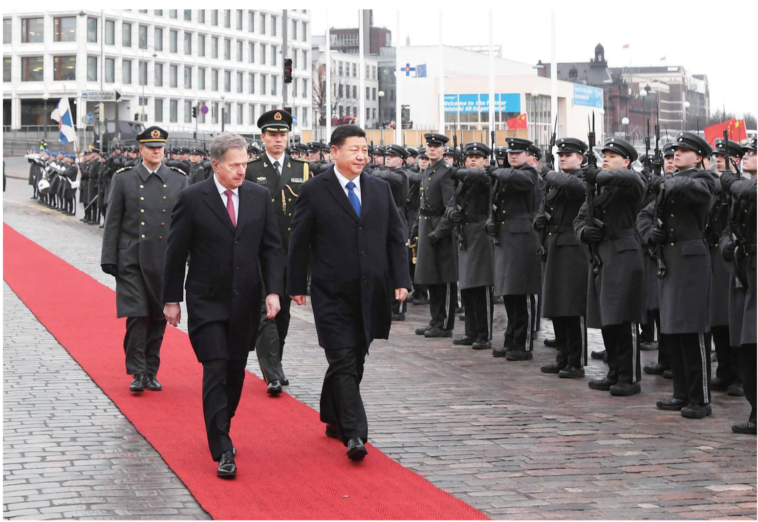
4月5日,习近平在赫尔辛基同芬兰总统尼尼斯托举行会谈。会谈前,习近平出席尼尼斯托在总统府庭院举行的隆重欢迎仪式。

本报赫尔辛基4月5日电(本报特派记者罗山)国家主席习近平5日在赫尔辛基同芬兰总统尼尼斯托举行会谈。两国元首高度评价中芬建立67年来双边关系取得的长足进展,共同宣布建立中芬面向未来的新型合作伙伴关系,表示双方要加强政治互信,深化务实合作,造福两国和两国人民。 习近平强调,中国和芬兰是相互尊重、平等相待、合作共赢的好朋友、好伙伴。两国人民始终对彼此怀有友好感情。芬兰人民正在开启两个一百年的奋斗目标,实现中华民族伟大复兴的中国梦而奋斗。中芬两国发展需求契合度很高。双方要从战略高度和长远角度出发,牢牢把握住中芬关系正确发展方向,加强高层交往,增进战略互信,巩固好双边关系政治基础,挖掘合作潜力,实现优势互补,在各自发展道路上相互支持。 习近平向尼尼斯托介绍了中国近期经济社会发展形势及发展前景。 尼尼斯托表示,热烈欢迎习近平主席在芬兰独立100周年之际来芬兰进行国事访问。芬方重视中国发展成就和中国在国际事务中的重要作用,期待着以习主席此次访问为契机,密切双方高层及各领域交往,深化经贸、投资、创新、环保、旅游、冬季运动、北极事务等领域和“一带一路”框架下合作,加强在重大国际问题上的沟通和协调,推动欧盟同中国更加紧密合作。 两国元首一致确认建立和推进中芬面向未来的新型合作伙伴关系。双方强调,构建更加具有前瞻性、战略性、时代性的中芬关系符合两国和两国人民根本利益。 双方重申相互尊重主权和领土完整,坚持相互尊重、平等相待原则,照顾彼此核心利益和重大关切。芬方重申坚定奉行一个中国政策。双方愿在合作中照顾彼此关键利益。 双方同意积极落实两国元首就中芬伙伴关系达成的重要共识,加强国家层面政治引领和全面协调,保持高层互访频率,加强两国政府、立法机关、司法机构及两国政党交流合作。 双方同意加强经济规划对接,探讨在一带一路框架内开展合作,共同促进亚欧大陆互联互通。要提升双向投资水平,推动双边贸易平衡增长,深化在循环经济、资源利用效率、可持续发展、环境保护、新型城镇化和绿色生态智慧城市建设、农林业、交通运输和信息通信技术、创新等领域合作,推进中芬生态园共建工作。 双方同意不断丰富人文交流形式和内容,增