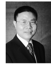
杨德林,清华大学经济管理学院创新创业与战略系教授