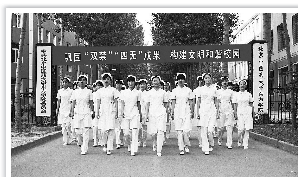
北京中医药大学东方学院莘莘学子意气风发

把师德师风建设与教学教改结合起来。高校是教书育人的殿堂，主阵地是教学教改。学院坚持把师德师风建设与教学教改结合起来，收到了可喜效果。