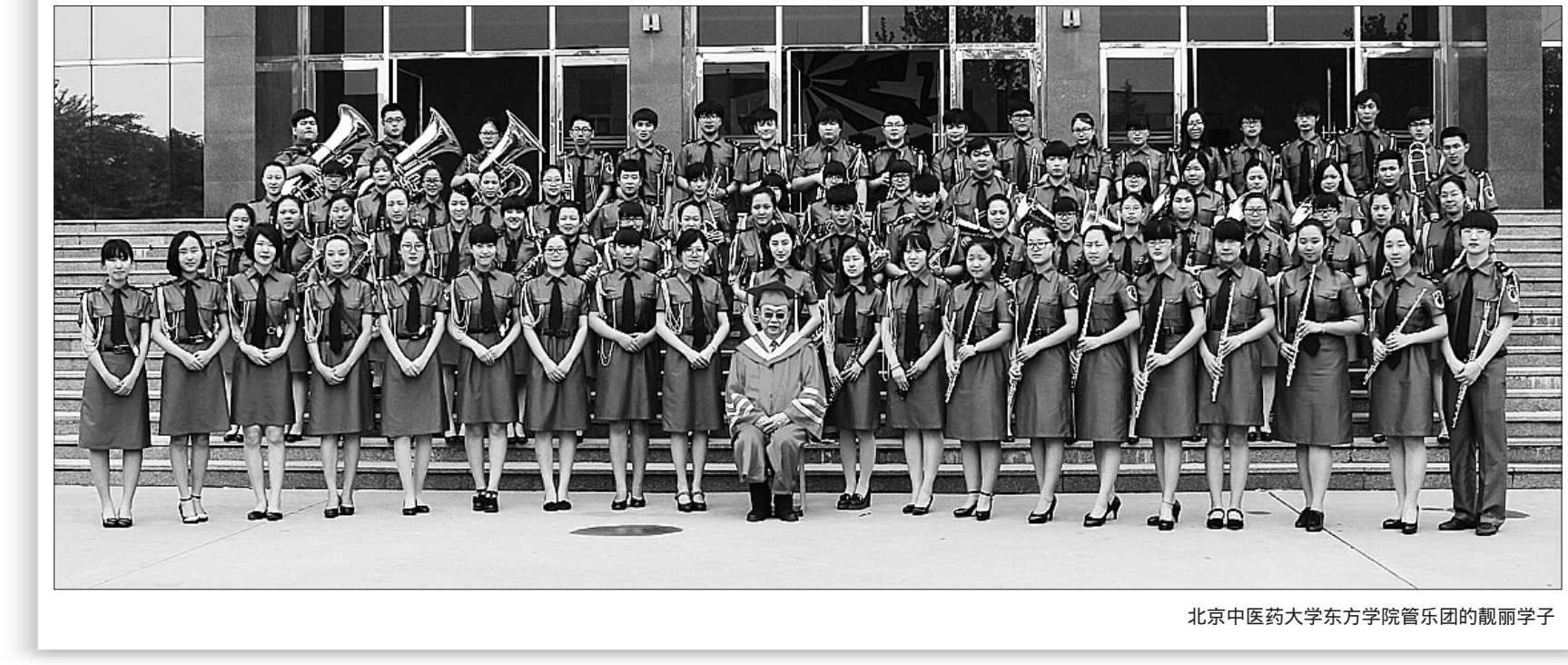
北京中医药大学东方学院管乐队的靓丽学子

抓教风，为师德师风建设提供新内涵。良好的教风是良好师德的必然反映。学院在加强师德师风建设中，十分注重教风的改善，要求教师，既抓好认真备课、更重视因材施教，使基础好的学生上好、基础差的学生后来居上。田院长常说：课堂教学是体现教师的主要阵地，必须一丝不苟，关键是师生之间要相互尊重，特别是教师，一定要用人格、道德和知识的合力去耕耘学生的心田，用自己的真情去激发他们的潜能。