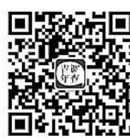
扫码关注微信公众号 民调新闻早知道

具体来看,34.1%的受访者希望校方推荐优秀小学生读物,引导兴趣,28.8%的受访者建议出版方编写适龄读物,融入丰富知识,24.5%的受访者建议家长与孩子互动,加强亲子阅读,10.6%的受访者希望在课堂上互动,教师带动学生兴趣。