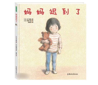
《妈妈迟到了》 [日]日本泉美/著 [日]冈田千晶/绘 李秀芬/译 郑州大学出版社

人生总会经历诸多等待,愿我们都能像幼儿园小朋友佳奈那样,学会往好处想 不管怎样,妈妈一定会来的!