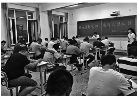
选手们在进行理论考试。