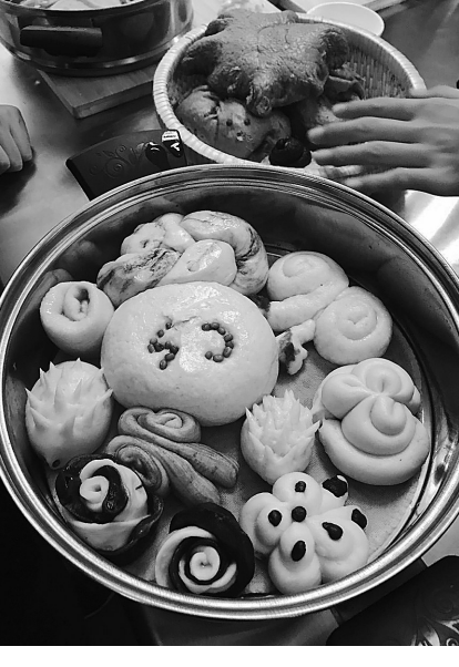
学生在学农课程中学习蒸馒头花卷,图片为他们的创意作品。