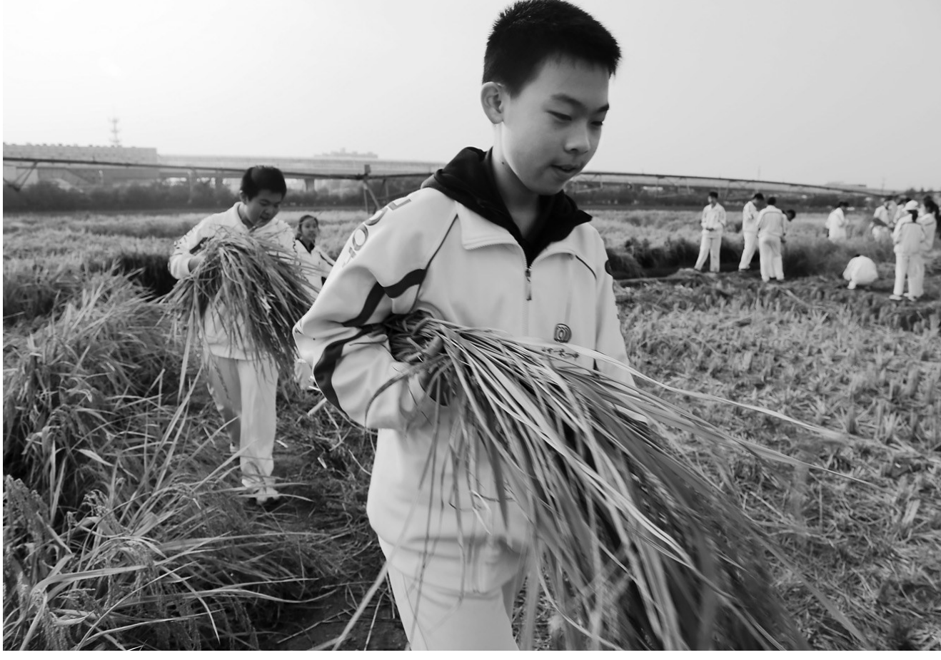
正在接受学农教育的初中学生,手拿刚收割完的水稻,准备运到脱粒区进行传统人工脱粒。