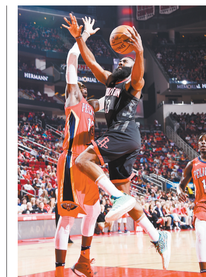
北京时间3月25日,NBA常规赛中,新奥尔良鹈鹕以91-114负于休斯顿火箭,后者曾为马刺制造不少麻烦。

造人格,培养运动员是目标,但不是重要目标,更不是唯一目标,学校培养出精英运动员,应是无心插柳成行的结果,而全体学生的身心健康、体魄强健才是有心栽花花盛开,这才是教育中体育的本来面目。他认为,真正的体教结合是建立让竞技体育回归教育体系的新的举国体制。建议从高校着手,加强高校学生体育对中小学体育的引导和激励机制,在高校经典赛事体系建设、高校教练员队伍建设等方面加强工作,这样对体育人才的需求就会自上而下层层覆盖,从而带动各级各类校园体育的进一步发展,这可能是有利于真正志向体育、有体育天分的学生发展体育特长的有效通道。呼吁广泛开展校园体育,让学生参与体育运动不受功利心驱使外,王宗平也强调要加强从小到大学的体育特长生培养通道的建设,而且这个通道应该相比现在更宽一些。他以中美对比说明,我们的大学高水平运动队的招生规模远远低于美国,发展潜力还很大。他期待相应的激励机制能尽快在后续的有关政策中看到,真正要治标,不仅仅是取消各类加分,而是要建立多元化、多维度的评价选拔体系,让各类具有鲜明个性、突出特长、创新潜质、综合素质优异的学生,都能脱颖而出,这才是发展素质教育的内涵所在。本报北京3月25日电