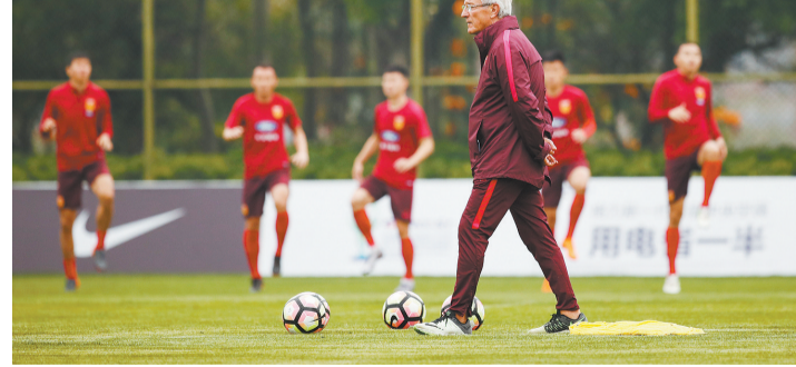
3月25日,国足在南宁备战中国杯三四名比赛。视觉中国供图

起里皮的调教。更何况年近70岁的里皮是职业足球教练并非神仙,他和其余优秀教练一样会犯错误,需要不断在比赛中进行修正。因此,与捷克队的比赛对里皮而言才是真正考验。捷克队与威尔士队实力相当,球队放下心理包袱打出令人满意的精神状态,则是比比赛胜负更为重要的危机公关。在今天的赛前训练中,姜至鹏和蔡惠康均已回归,但里皮还需要足够的人手来调整中后场防守区域,面对捷克队,整体防守是里皮灌输给球员的思想。波沃维奇仍继续施展着他的马刺魔法,将手中现有球员的实力压榨到极致,但现在这些魔法药剂就快要用完了。美国媒体评论道。幸运的是,马刺还有老本。过去6场比赛,马刺取得了全胜,吉诺比利表示,球队已经从低谷走了出来,之前我们有点儿士气受挫,有些低落,但是现在我们并不满足,我们要继续下去,不断提高自己。但危机并没有解除。从季后赛角度看,现在排名第九的掘金,距离马刺不过3个胜场,他们需要拼尽全力来保证能够进入季后赛。如果马刺杀入季后赛,这种可能性较大,但莱昂纳德不复出,以马刺目前的实力,他们显然在季后赛没有太多竞争力可言。至于未来,莱昂纳德会跟马刺续约吗,也将打个大大的问号。如果本赛季火箭可以用风调雨顺来形容,明星云集、天赋异禀则是勇士的注脚,那么马刺似乎有些风雨飘摇,但仍无需为马刺王朝的陨落而担心,他们已经一次次地证明自己能够卷土重来。只是,球迷确实已经很久没有为马刺如此揪心了。视觉中国供图