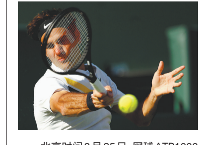
北京时间3月25日,网球ATP1000系列大师赛迈阿密公开赛男单第二轮焦点战,卫冕冠军费德勒冷以1-2不敌21岁小将科基纳吉斯。由于积分被扣除较多,费德勒将在新的一周世界排名中被纳达尔超越,丢掉世界第一的宝座。

台,又因国家相关主管部门的要求,国内球队不允许参加亚洲冰球联赛,中商泰达冰球国家队俱乐部在2017-2018赛季无法开打,原定的赞助协议也无法落实。没有比赛,运动员就很难得到相应的待遇。昆仑鸿星提供的年薪所打动,愿意代表昆仑鸿星参加VHL、MHL等比赛,也在情理之中。然而,一部分队员被“挖”走了,另一部分留下的队员依然无法开打,一支队伍的凝聚力就在这种走与留的选择中被撕裂。回顾过去两年,从KHL、NHL、VHL等国际职业冰球赛事在中国的登陆,再到4支冰球国家队俱乐部的成立,国内冰球呈现的是从未有过的盛世之景,但两年即将过去,中国冰球到底有多大提升?国内冰球发展环境真的是更优化、更规范了吗?齐齐哈尔男子冰球的发展与其当地政府的高度重视有着直接关系,这也意味着齐齐哈尔冰球的发展模式有很大特殊性,反倒是哈尔滨队的衰落和承德队的困扰更值得忧虑和深思。本报北京3月25日电