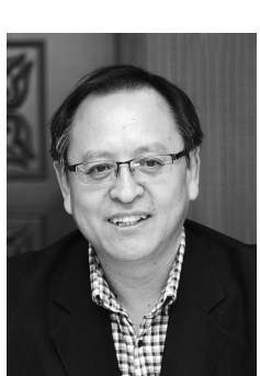
魏玉山，中国新闻出版研究院院长