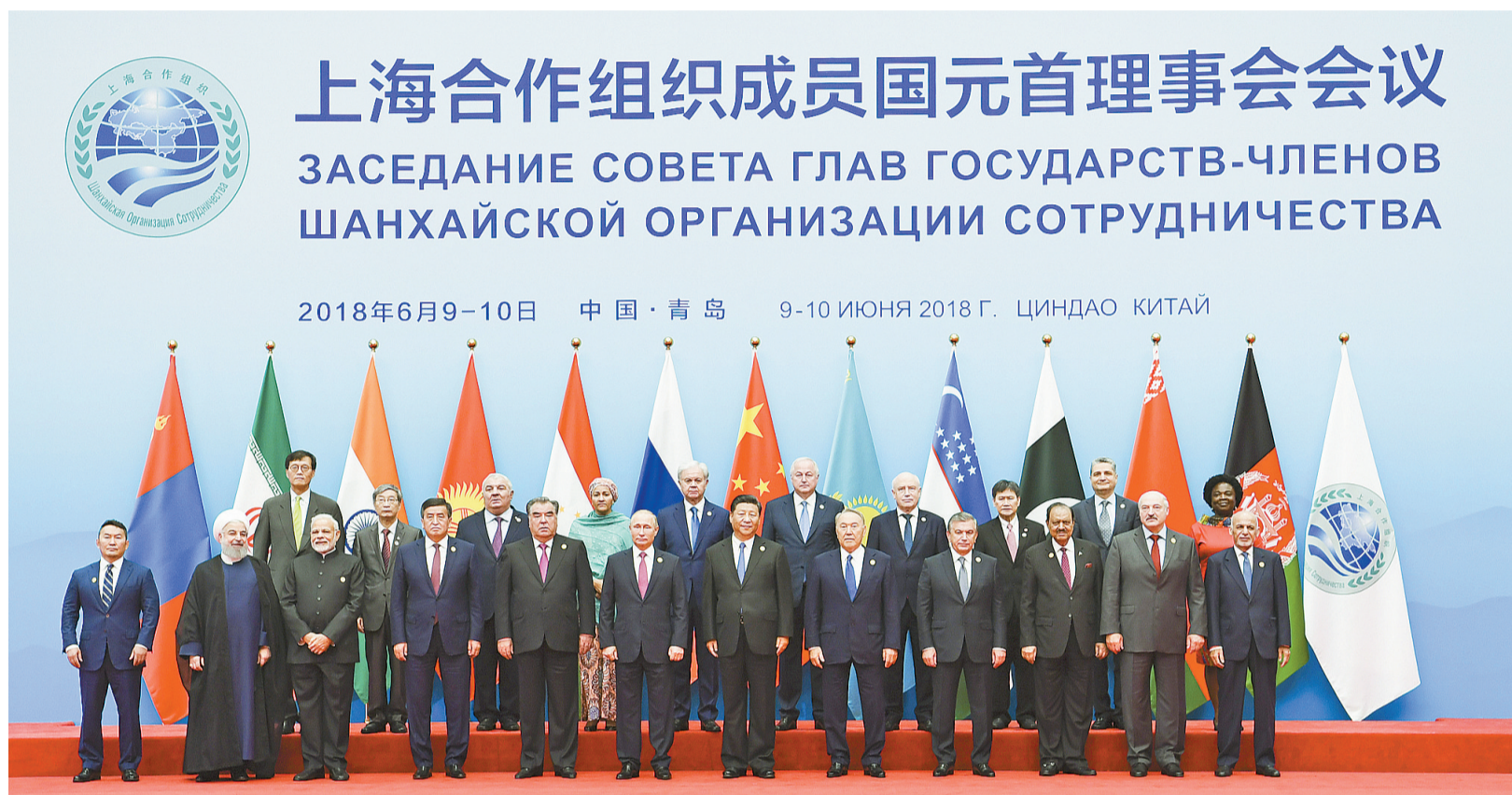
6月10日,上海合作组织成员国元首理事会第十八次会议在青岛国际会议中心举行。这是会前,习近平同与会各方在迎客厅集体合影。

新华社青岛6月10日电(记者李学忠 朱超)上海合作组织成员国元首理事会第十八次会议10日在青岛国际会议中心举行。国家主席习近平主持会议并发表重要讲话。上海合作组织成员国领导人、常设机构负责人、观察员国领导人及联合国等国际组织负责人出席会议。与会各方共同回顾上海合作组织发展历程,就本组织发展现状、任务、前景深入交换意见,就重大国际和地区问题协调立场,达成了广泛共识。