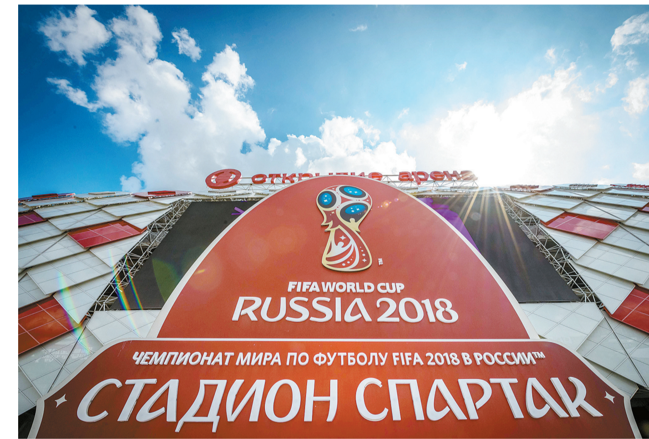
位于莫斯科的斯巴达克体育场已经为世界杯作好准备,该体育场将承办4场世界杯小组赛和1场1/8决赛。