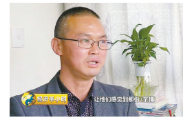
替牺牲的战友尽孝,在很多人看来,也许是当时青春年少、