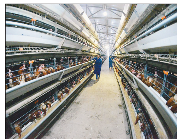
恒瑞博蛋鸡养殖项目