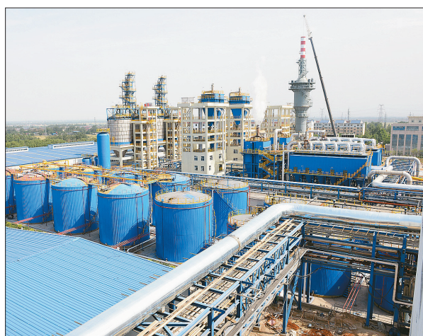
阳光集团安化化工有限公司投资4.12亿元建设炭黑加工精制及尾气发电项目