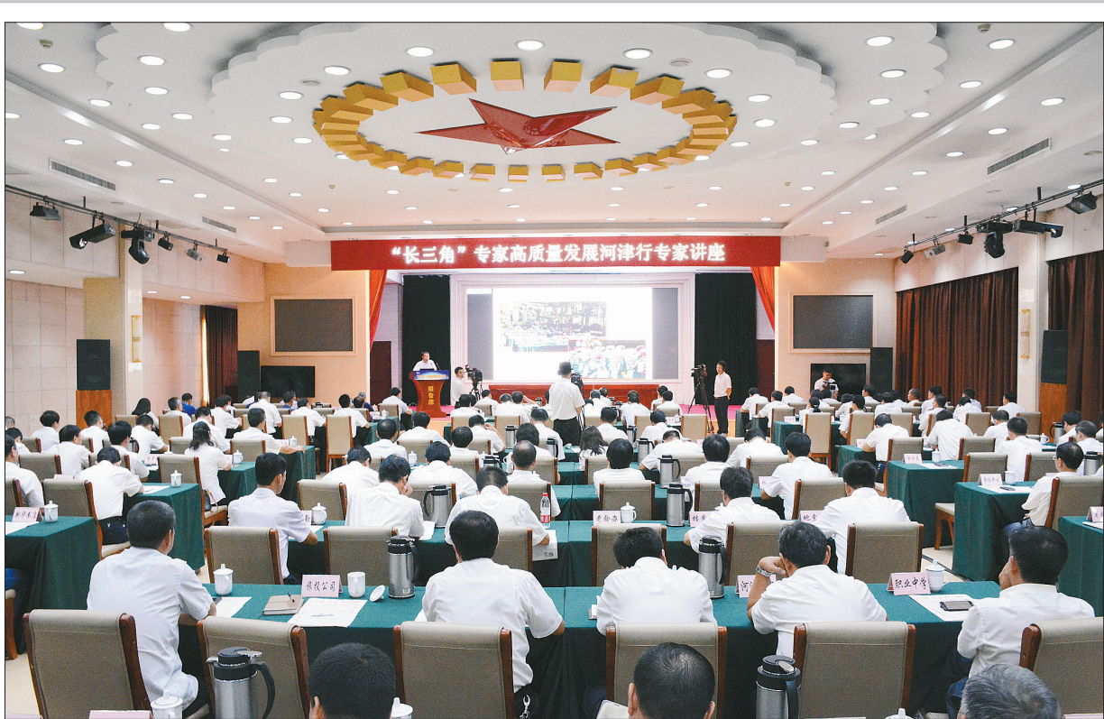
8月17日,长三角专家高质量发展河津行专题报告。来自长三角地区7所高校、2家科研院所的10位专家教授分别围绕新动能经济、现代农业、城乡建设、文旅融合等领域,作了精彩的专题报告

为提升行政效能,河津市党政班子成员领衔重点改革事项,拿出与企业赛跑的劲头,破除各种隐性壁垒,填平低效洼地,拉升工作标杆,提出“只进一扇门、只跑一次腿、只需动鼠标、只看结果到”的四只目标,全力解决好改革的痛点、难点和堵点。