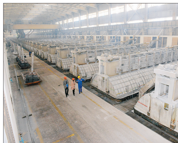
华泽铝电电解车间