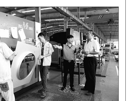
建设银行河北廊坊分行小企业中心客户经理定期走访合作企业，深入了解贷款用途和融资需求，为小微企业发展提供动力

中国建设银行将继续深入贯彻党的十九大精神，在普惠金融领域久久为功，培育经济发展新动能，为大众安居乐业、建设现代美好生活贡献更大力量！（数据来源：中国建设银行）