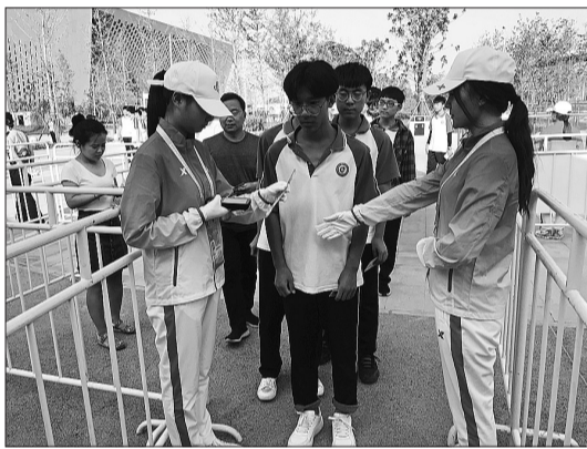
志愿者进行核验检查入场人员信息及证件演练。