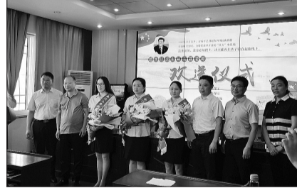
安徽合肥南门小学三位优秀教师即将前往四川凉山开展教育帮扶。

他告诉记者,学校将依托培养基地结对帮扶,积极开展教师、校长培训实践,发挥培养基地辐射作用,持续帮助凉山州提高教育发展水平,通过传帮带,留下一支永不撤走的教师队伍。