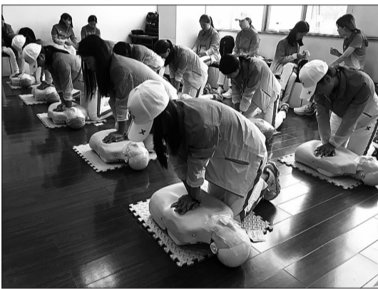
急救医疗志愿小队的志愿者接受业务培训。