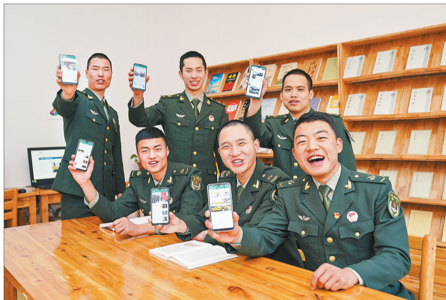
使用教育手机,已经成为基地官兵们日常生活的一部分。